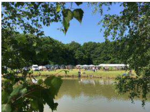
A rendezvény helyszíne

Létszám: 296 fő, szakmai közönség, egyéb érdekelt felek, önkéntesek 11 fő