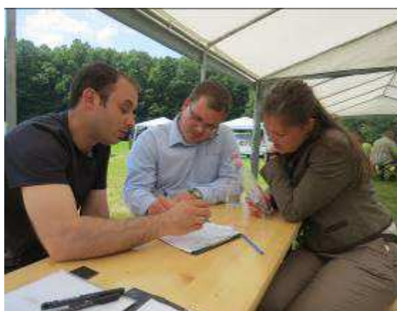
a gasztro bíráló bizottság