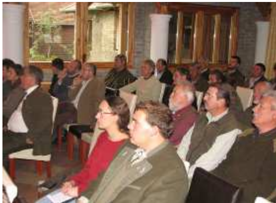
az előadás alatt..