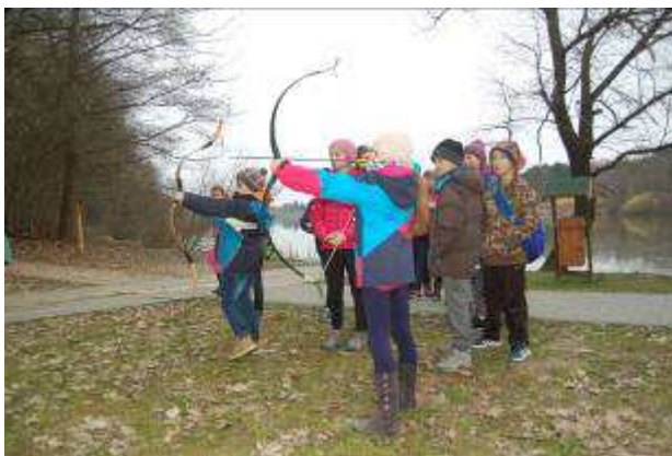
Terepi program a Gombás-Desedai parkerdőben