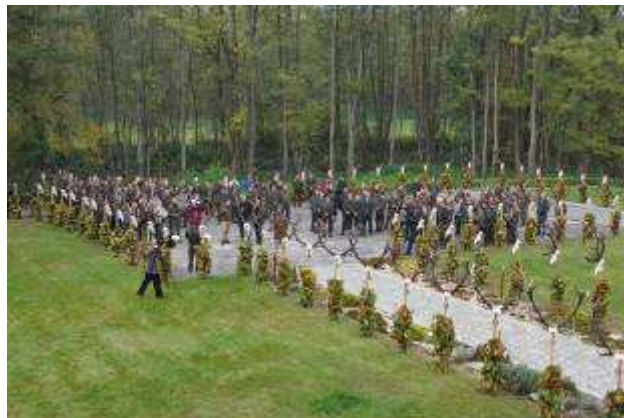
A trófea kiállítás