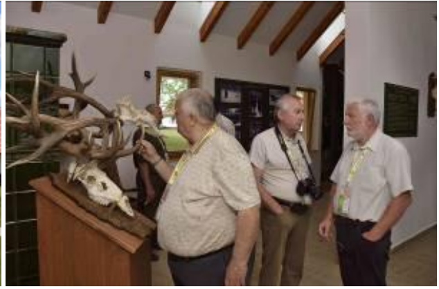
Az épület és látogatók a kiállító teremben