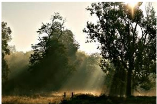
Képek a kiállítás anyagából