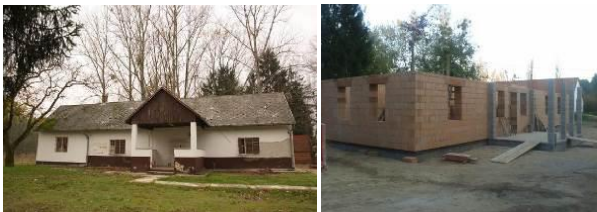
Az átépítés előtti állapot és a múzeum építése (október eleje)

Az elnökség a tagságtól felkérést és megbízást kapott a pályázati projekt szakmai és pénzügyi lebonyolítására.